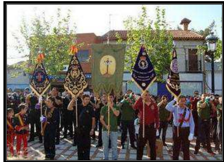
Certamen de Bandas de Cornetas y Tambores en Novés Año 2.011